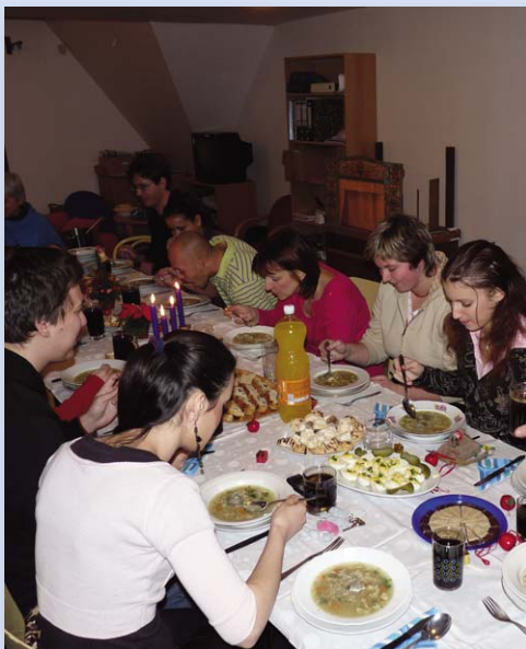
U vánočního stolu

Dvakrát ročně MAJÁK pořádá velká posezení, na která jsou zváni i bývalí obyvatelé, a sice: Letní grilování a Štědrovečerní večeře. Na obou akcích se letos sešlo 18 dospělých. Den před Štědrým dnem se kromě večere také zpívaly koledy a rozdávaly dárky pod stroměčkem. Přispíváme na doučovací hodiny dvěma studentům v rámci přípravy na zkoušky z odborných předmětů výučních oborů.