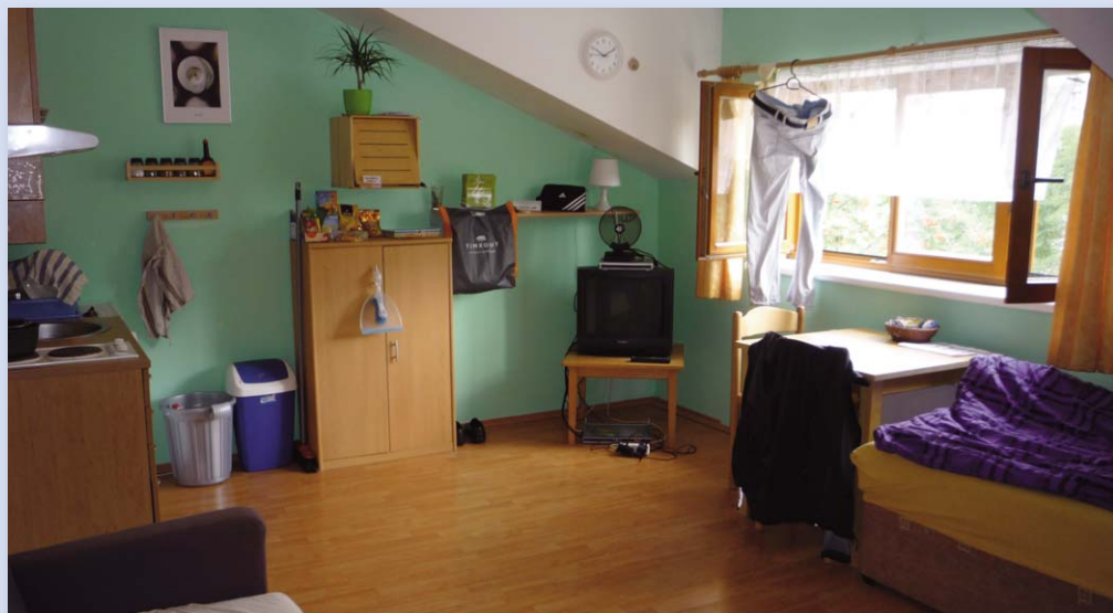
Tady bydlí kluci