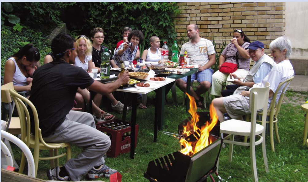
Grilování na farní zahradě