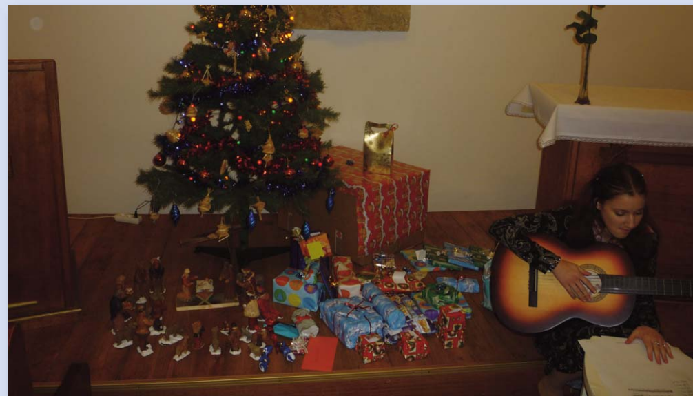
Hudební vystoupení u vánočního stroměčku