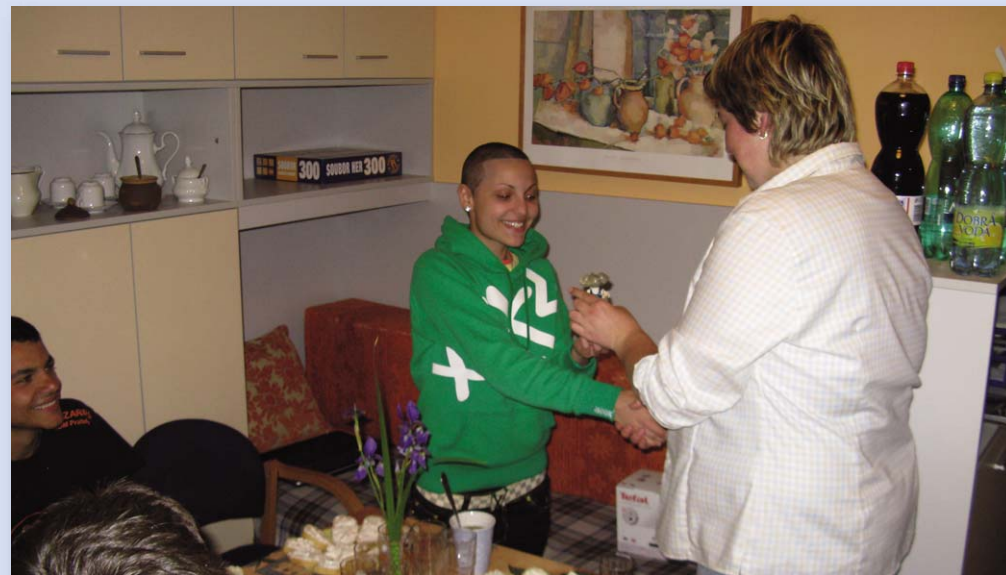
Loučení s odcházející obyvatelkou

Nový letáček o službě byl na konci roku zaslán do mnoha zařízení ústavní výchovy a sociálních odborů městských částí. Na konci prosince vyšel článek o MAJÁKU v časopise Rytmus života. O naší službě jsme informovali i na workshopu sociálních služeb pořádaném Městskou částí Praha 4. Pracovníci MAJÁKU letos absolvovali 28 dnů na školicích akcích a vzdělávacích seminářích, pořádaných např. Neziskovkami o.p.s., Průtkem nebo vzdělávací skupinou G&I. Dva pracovníci prošli také kurzem první pomoci.