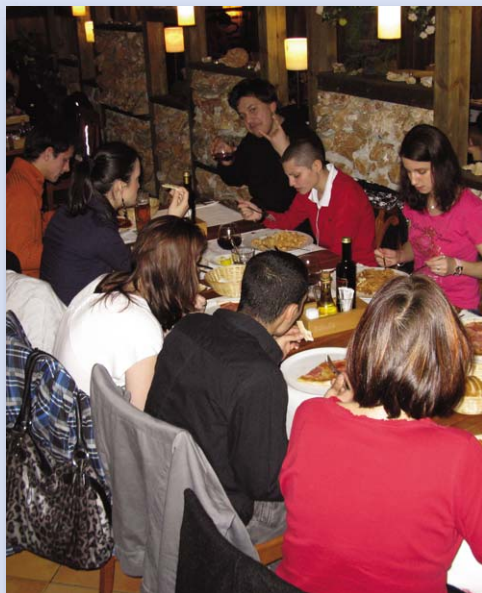
Na společné večeři v pizzerii